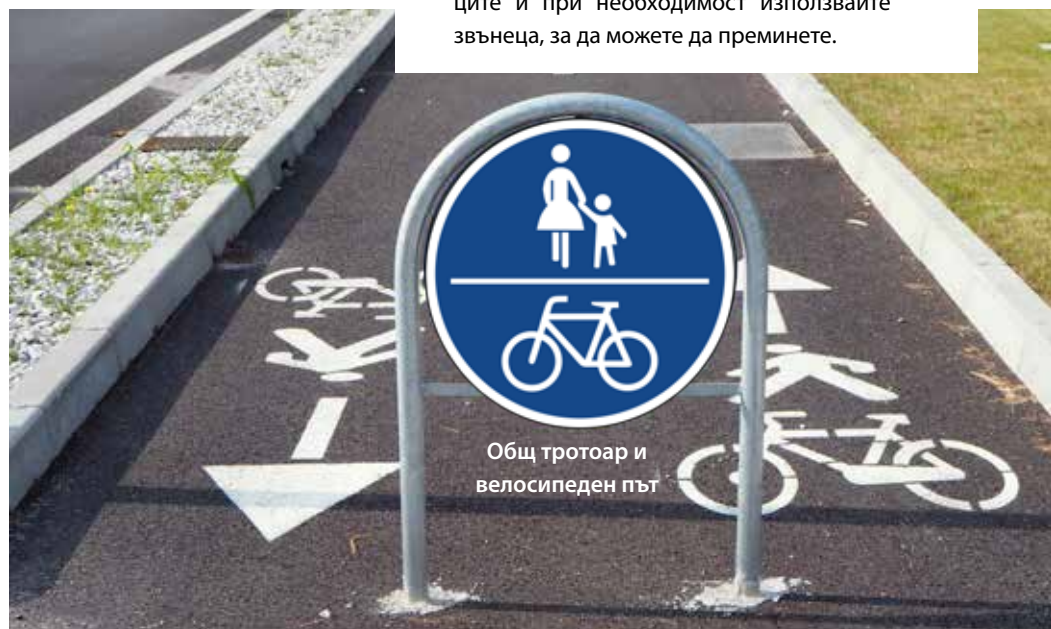
Общ тротоар и велосипеден път

Има също общи тротоари и велосипедни пътища . Велосипедистите трябва да карат по велосипедния път (забрана за движение по пътното платно). Те трябва да споделят пътя с пешеходците. Затова: Бъдете внимателни към пешеходците и при необходимост използвайте звънеца, за да можете да преминете.